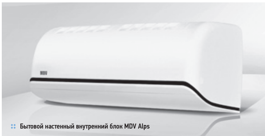
❖ Бытовой настенный внутренний блок MDV Alps

Мини-чиллеры MDV с воздушным охлаждением конденсатора и спиральными компрессорами. Производительность 10, 12, 14, 16 кВт. Походят для кондиционирования объектов, требующих небольшой производительности. Полностью готовы к монтажу, имеют встроенный гидромодуль. Теплообменник (испаритель) пластинчатого типа.