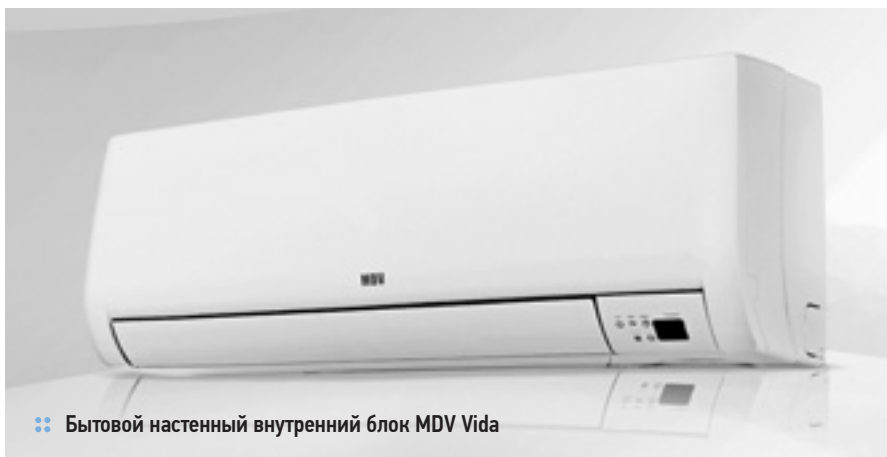
□□ Бытовой настенный внутренний блок MDV Vida